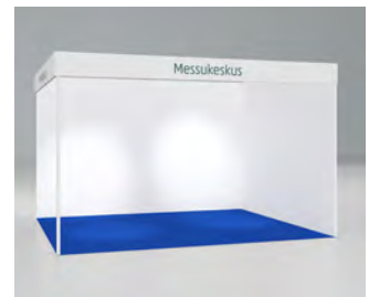
Standard väggskiva (hörnmonter)